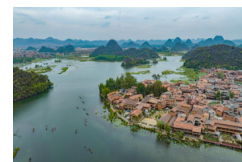
Yunnan: Parque Nacional de Humedales de Puzhehei en distrito de Qiubei