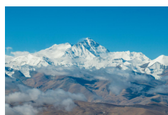
Tíbet: Paisaje de monte Qomolangma