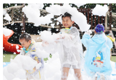
Celebran el Día Internacional del Niño en China