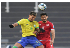
Imágenes de partidos correspondientes a los octavos de final de la Copa Mundial Sub-20 de la FIFA 2023